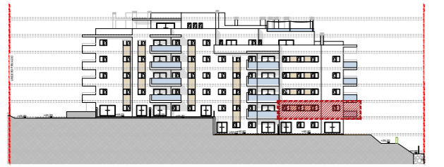
ISIDORA LIVING, LAS MESAS ESTEPONA (MÁLAGA)